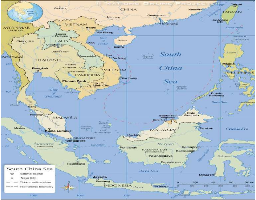
Harita 1. Güney Çin Denizi Haritası